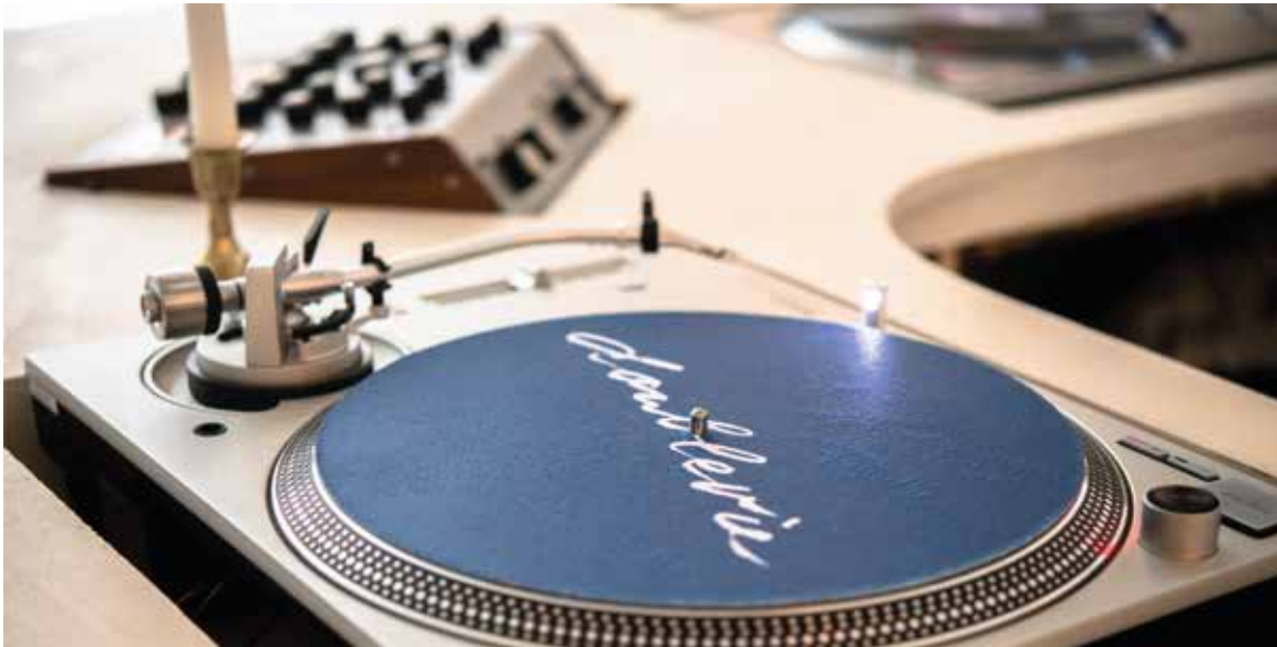
Bar - RDC